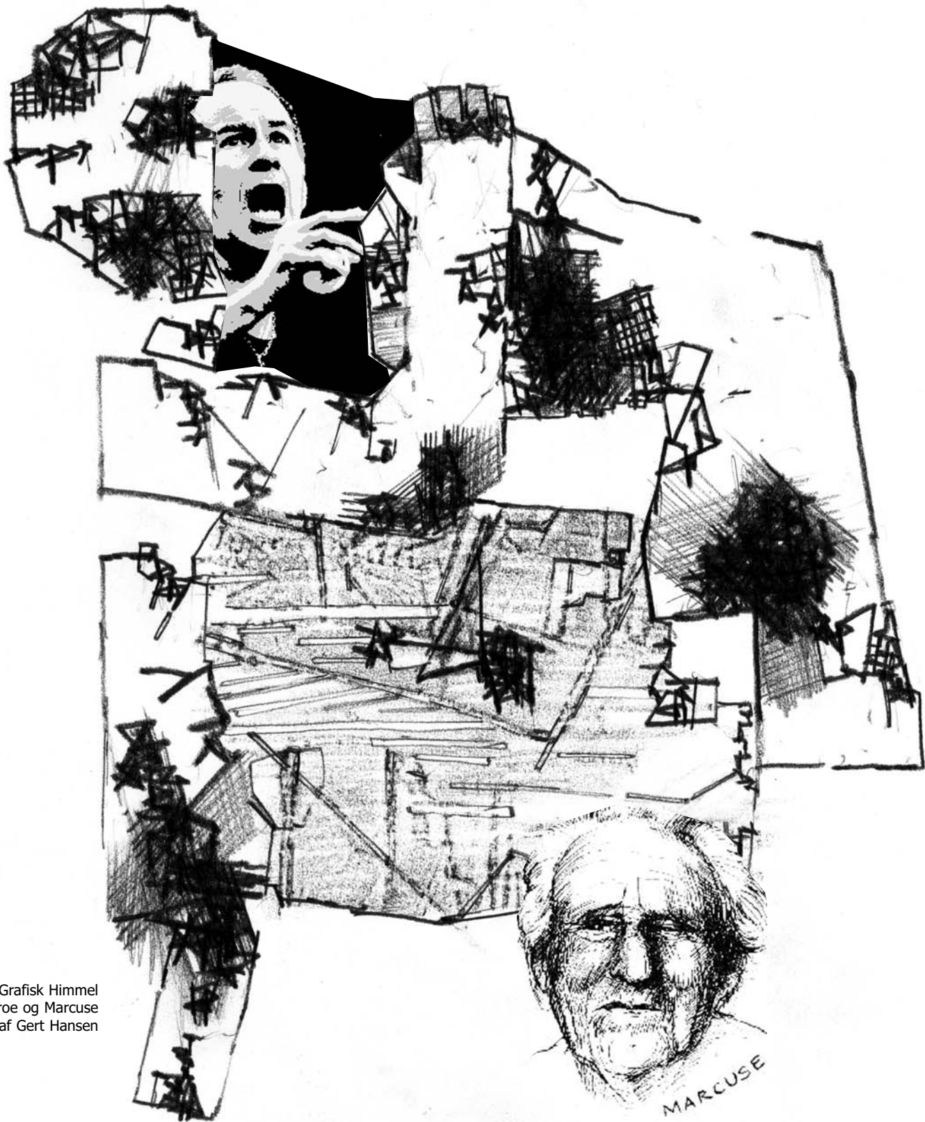
Collage af Grafisk Himmel med McEnroe og Marcuse og tegning af Gert Hansen